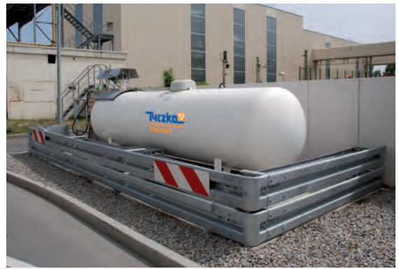
▲ Moderne innerbetriebliche MOTOGAS-Tankstelle