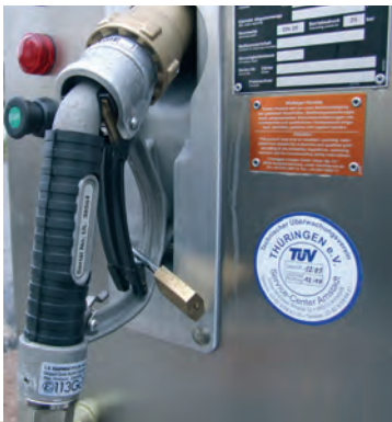
▲ Einfach tanken