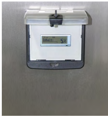
▲ Versorgungssicherheit durch Behälter Fernüberwachung über Funkmodem